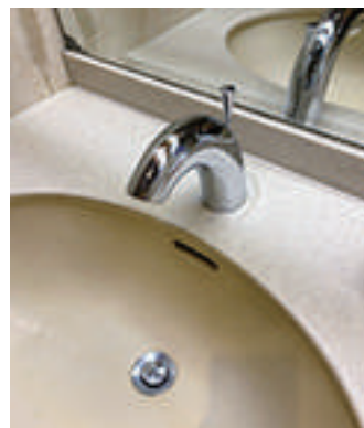
自動水栓を設置しました