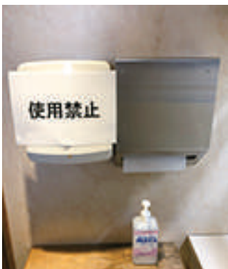
ハンドドライヤーの使用を禁止