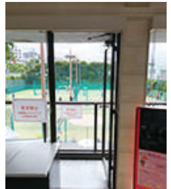
普段よりも長い時間換気