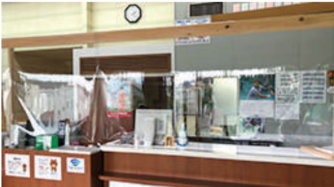
飛沫の飛散を防ぐためにビニールカーテン