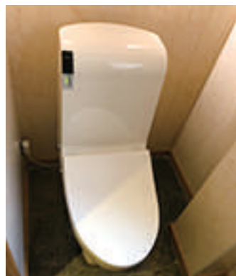
トイレの蓋を閉じ流してください