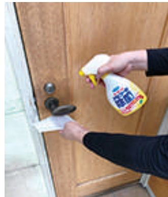
施設内の除菌清掃