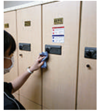
ロッカーの除菌清掃