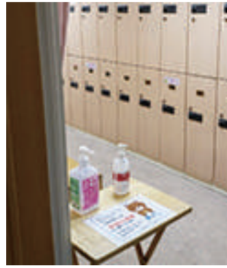
入室の際は手指消毒

※密を避けるため、可能な限り自宅でお着替えをお済ませになって御来校いただくと幸いです。